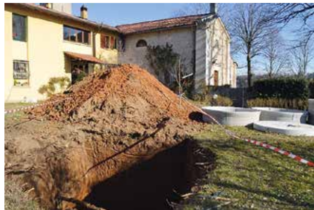
Scavo del pozzo ovest