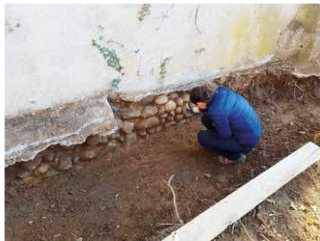
Fondazioni della chiesa